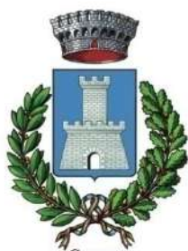
Comune di Roccanova