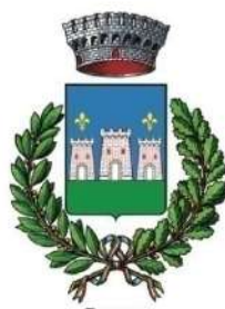
Comune di San Chirico Raparo